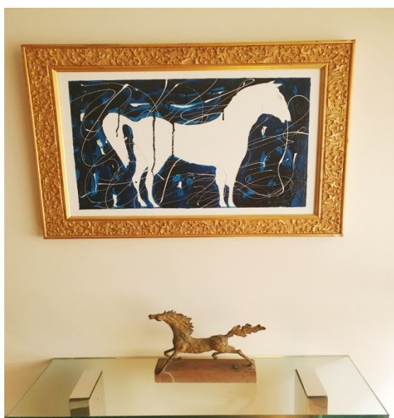
Sala riunioni della sede operativa della Fondazione: Mario Schifano, “Il Giorno” e “La Notte”

Care Amiche e cari Amici anche in tempo di Covid l'attività della Fondazione non si ferma! Nell'attesa di poter riprendere le attività in presenza relative alle celebrazioni del Ventennale della nascita della Fondazione Ducci in Italia e del Decennale della creazione della sede di Fès; nella nuova dimensione della DAD (didattica a distanza) stiamo organizzando dei seminari in modalità telematica attivi presso l'Università di Roma “La Sapienza” e presso la UNINT. Mai come in questo momento, infatti, si è compresa profondamente la necessità per le istituzioni culturali di dover collaborare tra loro, al fine di dare una più ampia offerta ai propri fruitori. Ed è per questa ragione che la Fondazione ha deciso di estendere l'iniziativa anche a voi tutti, cari Amici. Chiunque fosse interessato a partecipare ai seminari on-line potrà dare la propria adesione scrivendo NOME, COGNOME, RECAPITO TEL., INDIRIZZO EMAIL a segreteria@fondazioneducci.org , indicando nella propria iscrizione quale o quali seminario/i s'intende seguire. Quote di partecipazione: 1 seminario 50 €, 3 seminari 100€, per l'intera sessione dei seminari € 250. Per i soci